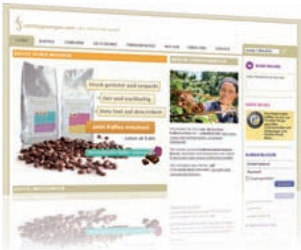
Bundespreisträger – 1. Platz www.sonntagmorgen.com

Unter den 13 Landessiegern haben die Juroren des Bundeswettbewerbs im Juni 2011 die drei Sieger ermittelt. (Mehr Informationen zum Bundeswettbewerb finden Sie unter http://www.website-award.net )