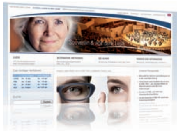
Bundespreisträger – 3. Platz www.bessersehen.eu

Die Fachzeitschriften Computerwoche, Markt und Mittelstand und das e-commerce Magazin vergaben – ebenfalls im Juni 2011 – einen Publikumspreis an den Landessieger, der im Online-Voting die meisten Stimmen erhalten hatte.