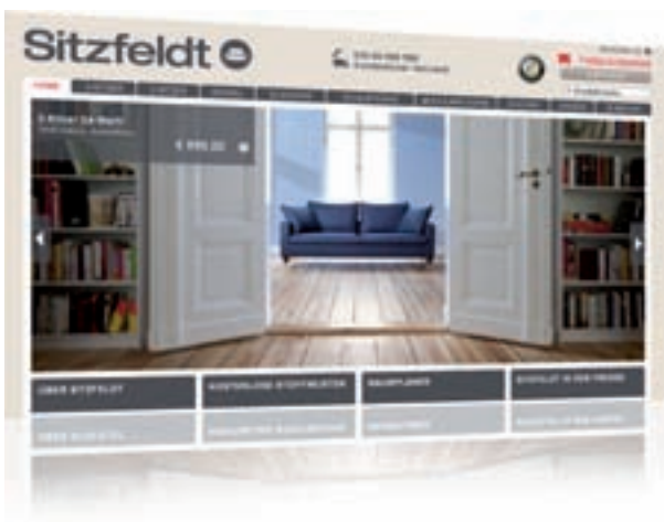
Bundespreisträger – 2. Platz www.sitzfeldt.com