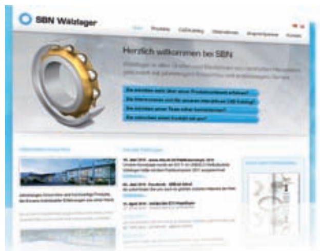
Bundespreisträger – Publikumspreis www.sbn.de

Die Fachzeitschriften Computerwoche, Markt und Mittelstand und das e-commerce Magazin vergaben – ebenfalls im Juni 2011 – einen Publikumspreis an den Landessieger, der im Online-Voting die meisten Stimmen erhalten hatte.